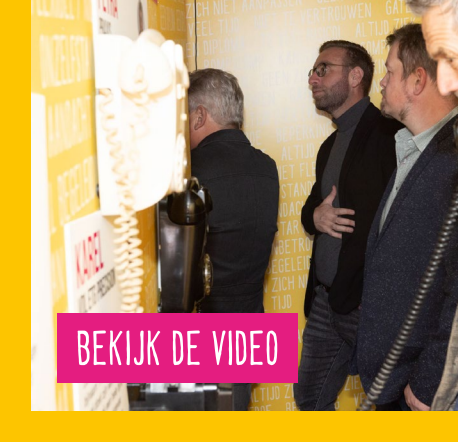
VOC BIJ BESTRONICS