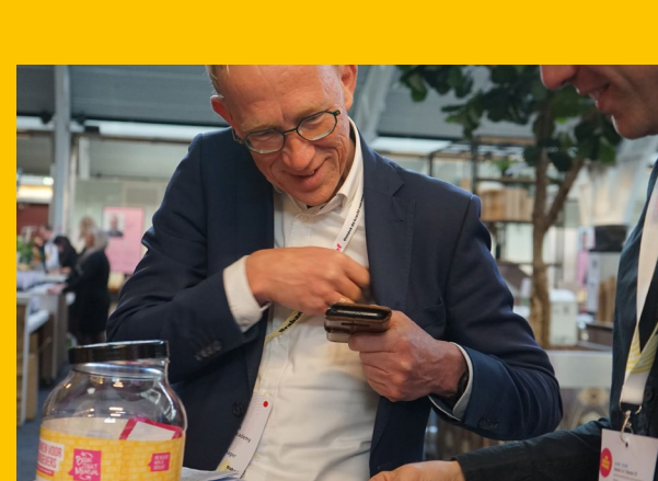
BRABANT WERKT INCLUSIEF