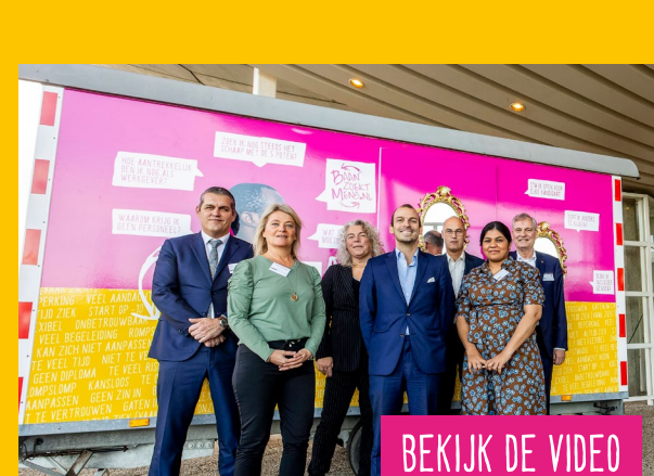
DAG VAN DE ONDERNEMER

Waar de Baan zoekt Mens™ Experience heeft gestaan: