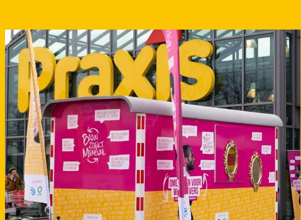
BEDRIJVENTERREIN DE HURK