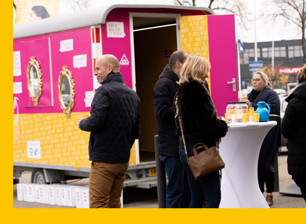
BANENMARKT KEMPENPLUS & UWV

In totaal beleefden ca. 750 professionals de experience.